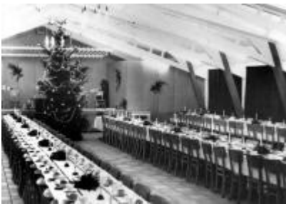
Kerstfeest in de Bendienfabriek, klik op de foto voor een vergroting

De huisvesting in Bendien duurde 5 jaar.