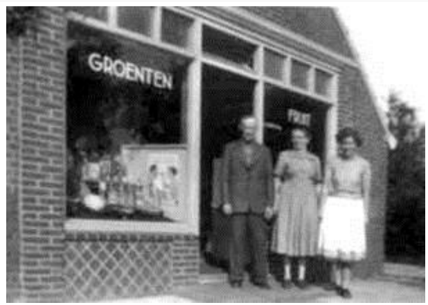
De groentewinkel van Kleefman, waar in de kamer de eerste kerkelijke activiteiten plaats vonden

Langs deze wegen werden in de twintiger jaren van de vorige eeuw woningen gebouwd en aan het eind van de Warmeerweg kwam er de groentewinkel van de familie Kleefman. Er werden in de wijk Emmermeer ook nog een aantal plaggenhutten bewoond en aan de Odoornweg was het woonwagencentrum ontstaan.