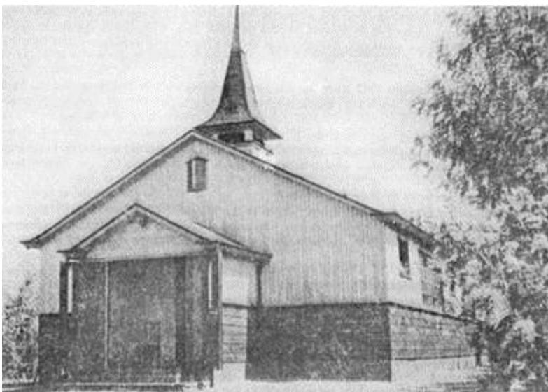
Het noodkerkje aan de Heidelaan

Omdat in 1941 het zielental van de Gereformeerde Kerk in Emmen gestegen was tot boven de 1300 en het kerkgebouw aan de Wilhelminastraat, de Zuiderkerk daarom te klein werd, werd besloten om ook in Emmen-Noord een tweede kerkgebouw te bouwen.