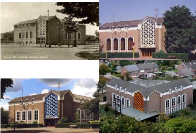
Gebouw Ichthus, in verschillende tijden en kleuren, klik voor een vergroting op de foto

Het interieur van de kerk kreeg haar huidige kleuren, een nieuwe preekstoel, doopvont en avondsmaalstafel werd op het podium gezet en het plafond van het podium kreeg een nieuwe uitstraling door verlichting en het meubilair beneden werd vernieuwd. Beneden werd de inrichting ook aangepast aan de eisen des tijds.